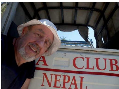
Bohater sentymentalnej podróży

tras trekkingowych. Wybrałem, notabene ponownie, najpopularniejszą trasę wiodącą wokół Annapurny – 8091 m (dziesiątego pod względem wysokości szczytu świata). Przebycie całej trasy 220 km z przejściem przez słynną przełęcz Thorong – 5614 m, wymaga wędrówki w ciągu 22–23 dni. Poprzednio, w roku 2007 przebyłem około połowy trasy, rozpoczynając trekking w wiosce Birethanti – 1025 m, teraz tak samo, jednak wędrówka trwała krócej. W górach nie wszystko zależy od nas. Na trasie, będącej jak niegdyś szlakiem handlowym (do miasteczka Jomson i dalej do krainy dawnego Królestwa Mustang), ponownie przechodziłem mosty wiszące, pola ryżowe, lasy dębowe i rododendronowe, wioski i przysiółki. Napotkane tam obiekty sakralne, stopy, mosiężne młynki modlitewne, wielobarwne chorągiewki z nadrukowanymi tekstami i rysunkami, nadto świadczą o religijności zamieszkującej tam ludności z grupy etnicznej Thakali, wyznającej buddyzm tybetański. W Nepalu trwa swoista „symbioza” buddyzmu i hinduizmu. W wioskach niżej położonych na początku trasy sąsiadują z sobą symbole obu religii. Tolerancyjni buddyści zachowują pełny szacunek dla symboli i wyznawców innych religii.