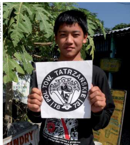
Promujemy PTT w Nepalu

Powstrzymuję się od szerszego opisu wrażeń z wędrówki szlakiem na wysokościach nieco powyżej tatrzańskich szczytów, zaiste, tam w obliczu sześcio-