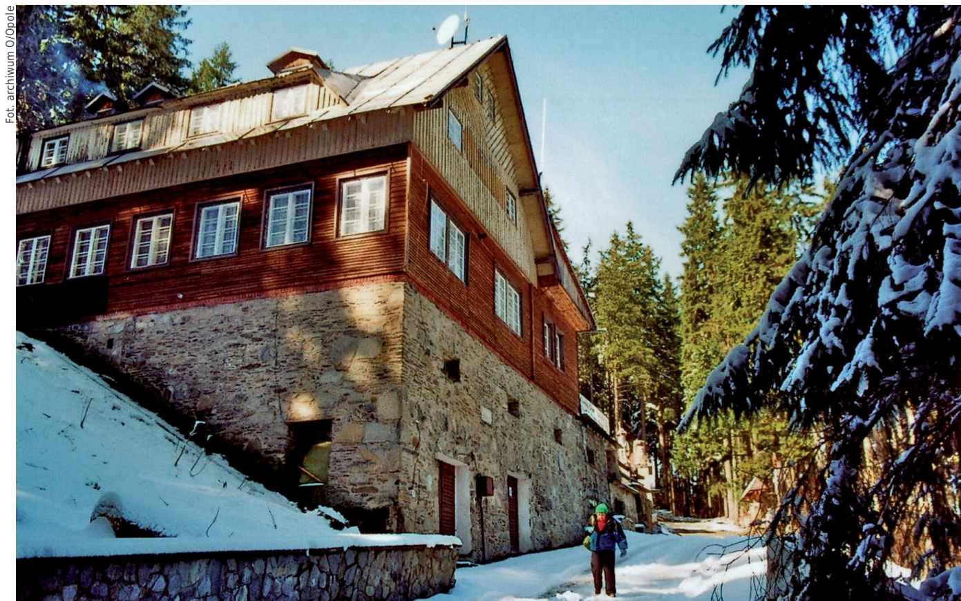
Schronisko Kopa Biskupia

Mogłoby się wydawać, że młodzież, która przed rozpoczęciem terapii interesowała się głównie narkotykami i gramami komputerowymi, nie będzie skłonna do korzystania aktywnie z tego typu wyjazdów. Okazuje się jednak, że dla wielu z nich zdobycie szczytu, przejechanie rowerem kilkudziesięciu kilometrów czy przepłynięcie Czarnej Hańczy pod prąd jest ogromnym sukcesem i przekłada się na kontynuowanie tych zainteresowań po zakończeniu pobytu w ośrodku i dla niektórych staje się to pasją. ■