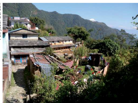
Wioska przy szlaku

rzeniem na himalajski krajobraz, nadal poznawać ludzi różnych grup etnicznych, plemion, ich zajęcia i zwyczaje ściśle związane z górami, religią i tradycją. Himalaje – góry o niebotycznych wysokościach, interesujących kształtach, kolorach i przyrodzie, budziły szczery zachwyty i utkwily w sercu i pamięci. Trekking na himalajskich wysokościach wymagał nieco wysiłku ciała i przysporzył radości duszy.